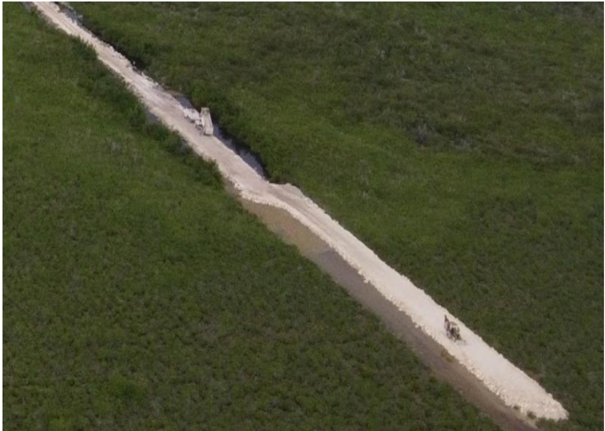
Vista general de caminos y lotificación de humedal costero en ecosistema de manglar.